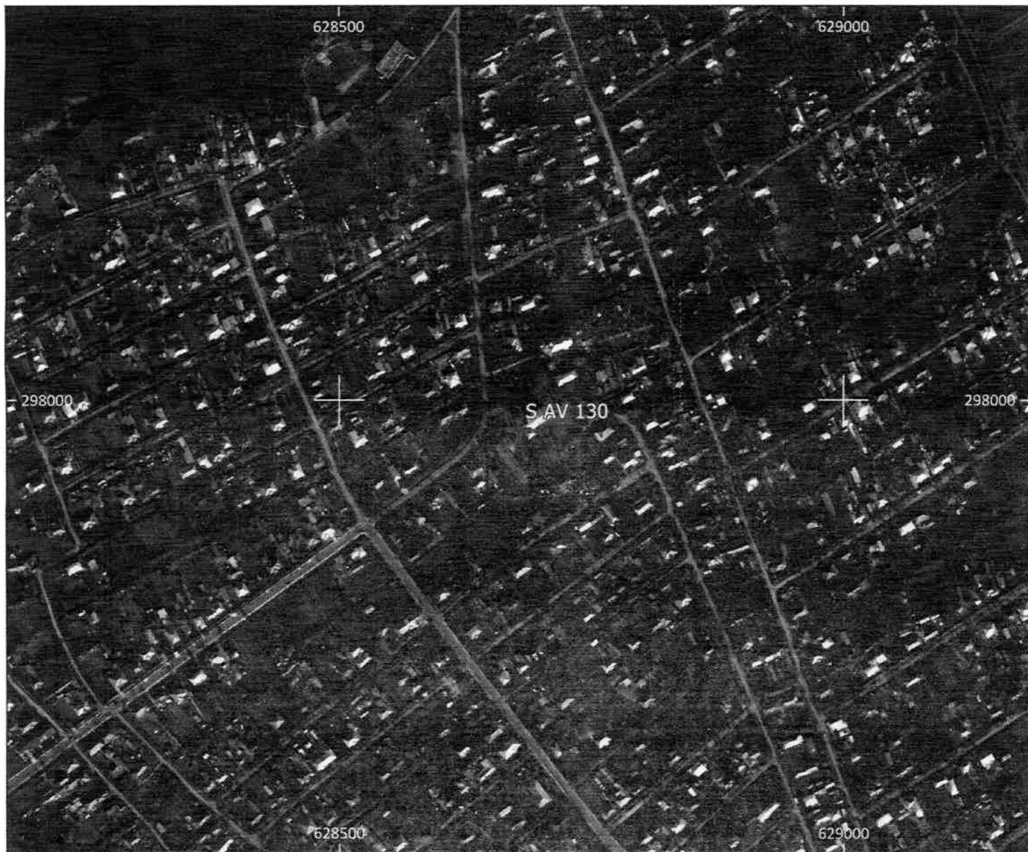
Amplasament sirena - Faza HCL